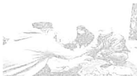
Gambar 2. Proses berlangsungnya akad nikah pasangan kawin lari.