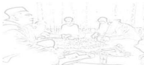
Gambar 1. Pemberian nasehat perkawinan kepada pasangan kawin lari oleh wali nikah palsu.

Meskipun seperangkat aturan tentang perkawinan telah dirumuskan dan diaplikasikan, namun aktifitas praktik kawin lari terus ada. Hal ini sebenarnya merupakan profesi warisan kepada penerusnya, sehingga tidak terlalu mengherankan jika praktik kawin lari sudah ada sejak dahulunya. Poin yang terakhir ini diduga sebagai akar persoalan praktik kawin lari di Kota Padang, karena bagaimanapun kuatnya peraturan, jika pola kaderisasi masih berlanjut, kemungkinan fenomena tersebut tetap berjalan hingga seterusnya. Kaderisasi ini biasanya dilakukan terhadap orang-orang yang berguru kepadanya dan kepada anaknya sendiri. Dengan demikian, dapat dipahami bahwa banyak wali palsu untuk prosesi kawin lari di kota Padang. Kegiatan ini sudah dilakukan sejak lama, bahkan secara berkelanjutan dan terpola sampai saat ini. Dengan demikian, pemahaman tentang perkawinan pada masyarakat tertentu, terdapat perubahan nilai dalam budaya, baik secara agama maupun adat pada masyarakat. Nilai budaya perkawinan merupakan unsur-unsur penting suatu tradisi perkawinan, yang berhubungan yang terdapat dalam prosesi aktifitas perkawinan, baik material perkawinan maupun sosial yang menjadi dasar dan tujuan sebuah perkawinan dalam masyarakat tertentu, sehingga menjadikan kawin lari sebagai alternatif jika mendapatkan halangan untuk melaksanakan perkawinan, terlepas halangan itu karena faktor agama, adat atau aturan dari Negara (Samsudin, 2016).