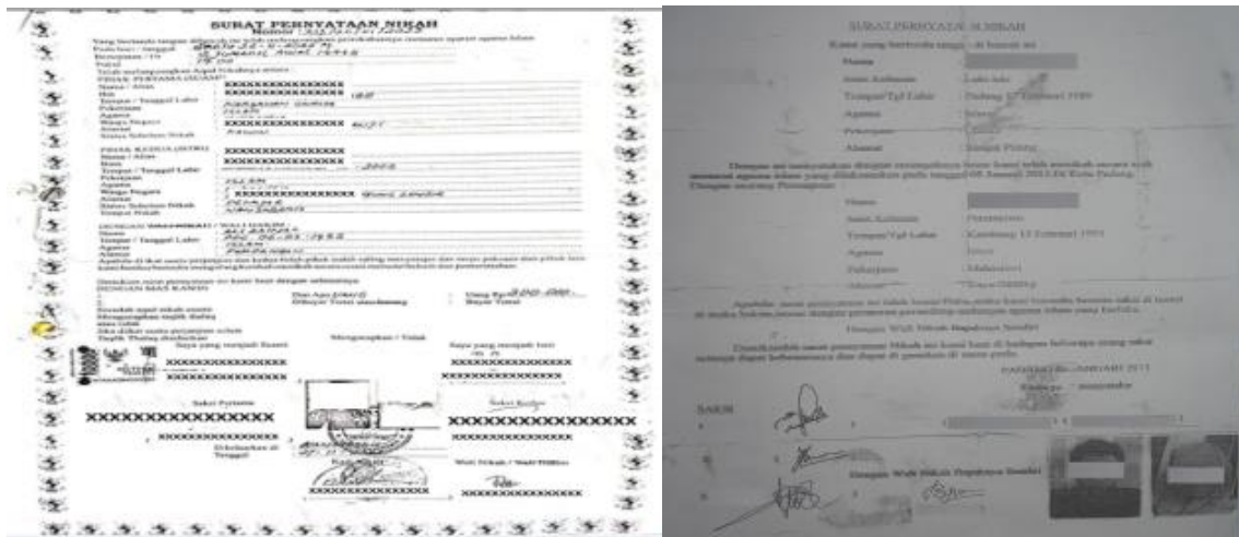
Gambar3. Contoh surat pernyataan akad nikah pasangan kawin lari yang dikeluarkan oleh jasa praktik kawin lari

Adapun tokoh agama yang melangsungkan pernikahan pasangan kawin lari mereka beralasan tidak setuju dengan peraturan negara. Menurut mereka, pernikahan itu tidak perlu dicatat. Bahkan, tatacara pernikahan dan prosesi perkawinan yang ditetapkan oleh negara telah melanggar aturan agama. Di samping alasan itu, mereka menikahkan pasangan kawin lari dengan alasan membantu pasangan yang tidak direstui, dikhawatirkan melakukan perzinahan. Dengan demikian, pemahaman oleh sebagian masyarakat berpendidikan rendah memahami orang yang menikahkan pasangan kawin lari dinilai oleh masyarakat sebagai orang yang paham agama atau disebut ulama. Pemahaman ini akan semakin kuat di mata pasangan kawin lari ketika dia memahami semua tata cara pernikahan, lengkap dengan khotbah pernikahan, dan diperkuat dengan adanya buku nikah. Sangat mungkin kondisi ini akan merangsang pasangan kawin lari bahwa tindakan mereka sudah benar. Kawin lari yang mereka lakukan tidak akan dipahami sebagai perbuatan dosa karena seolah-olah telah dijamin oleh ulama yang ia yakini. Hal ini juga membuktikan bahwa pasangan kawin lari itu tidak memahami tata cara, rukun, dan syarat perkawinan. Mereka hanya percaya bahwa selama pernikahan mereka dilakukan oleh orang yang dianggap alim