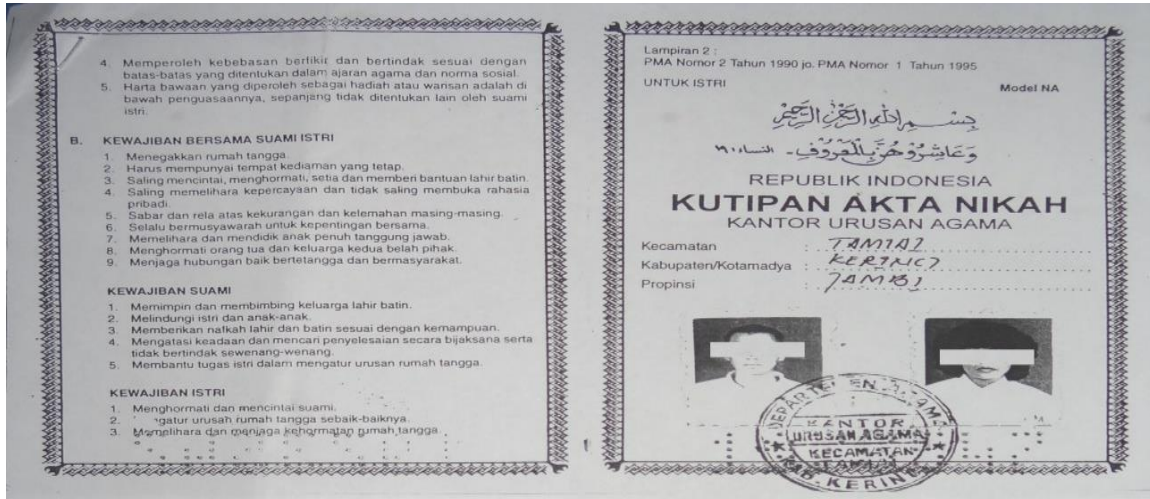
Gambar 3. Contoh akta nikah yang dipalsukan lokasi perkawinan praktik kawin lari.

Yang menikahkan saya dulu biasanya dipanggil angku kali. Tapi waktu itu, saya rasa dia sudah pensiun dan tidak lagi bekerja dari tugasnya sebagai anggota P3N. Ada beberapa yang saya tahu, dia mantan anggota P3N yang lama, sudah pensiun. mengerti tatacara berurusan di KUA, tetapi karena ilmu agamanya sedikit, makanya mau melakukan pekerjaan seperti itu (wawancara, 2014).